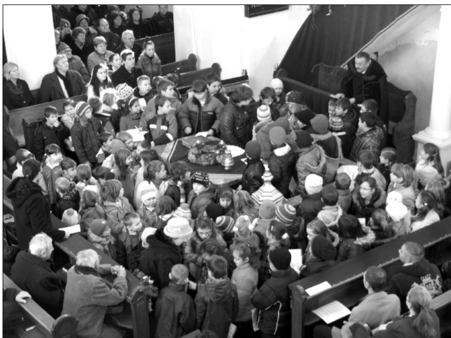
Jézus születését ünnepeltük hittanosainkal

A református hitoktatásban nem csak tudásanyagot adunk át, hanem közösséget is teremtünk gyermekeink számára.