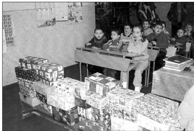
Kárpátaljai gyerekek örülnek adományainknak

Ne felejtjük el azt sem, hogy régóta gyűjtünk karácsony előtt egy cipősdoboznyi szeretetet. Mellékelek egy képet, amin viszontláthatjuk karácsonyi adományaink egy részét, amint arra várnak csillogó szemmel a gyerekek, hogy megkaphassák ajándékukat. Sokaknak ez az egy lesz a fa alatt! Karácsony előtt azonban figye-